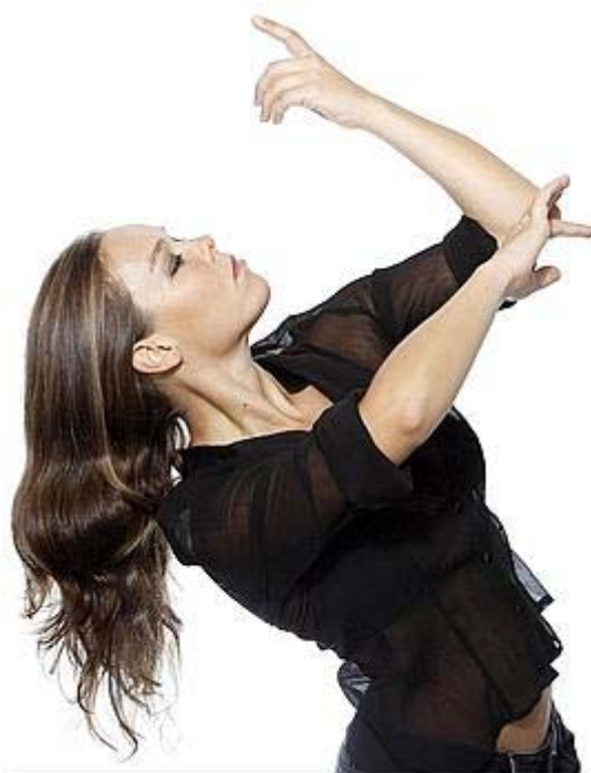
Rocio Molina, star montante qui danse d'une

L'Unesco vient de classer le flamenco patrimoine immatériel de l'humanité, mais Séville s'en fiche. Ce 8 juin, aux portes de la ville, les différentes paroisses sont rassemblées pour le pèlerinage du Rocio: femmes en robe à volants, coiffées de peignes hauts, hommes en costume gris et chapeau plat montés sur de piaffants andalous, bœufs aux cornes enrubannées tirant l'autel des vierges des différentes paroisses. Pas un touriste, pas un intrus. Sur le passage des cortèges, les gens se signent. Et le vent léger fait danser les eaux vertes du Guadalquivir.